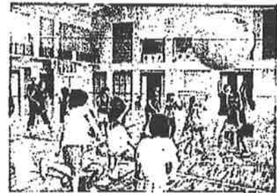
「元気にレクスボ キンボールで遊ぼう」から

このクラブは、子どもたちと指導者が一体となって子どもの居場所を見つけ、この1年間いろいろな活動をしていく団体です。友だちを誘って、たのしいクラブを作りましょう。ぜひ、参加してください。